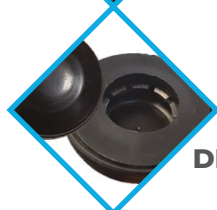
SYSTÈME DE BLOCAGE DE ROUE RENFORCÉ