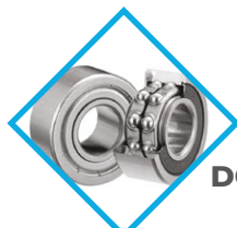
ROULEMENTS À BILLES DOUBLE ÉTANCHÉITÉ